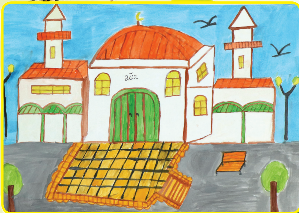
Хюсеин Караали, Районно мюфтийство-Разград