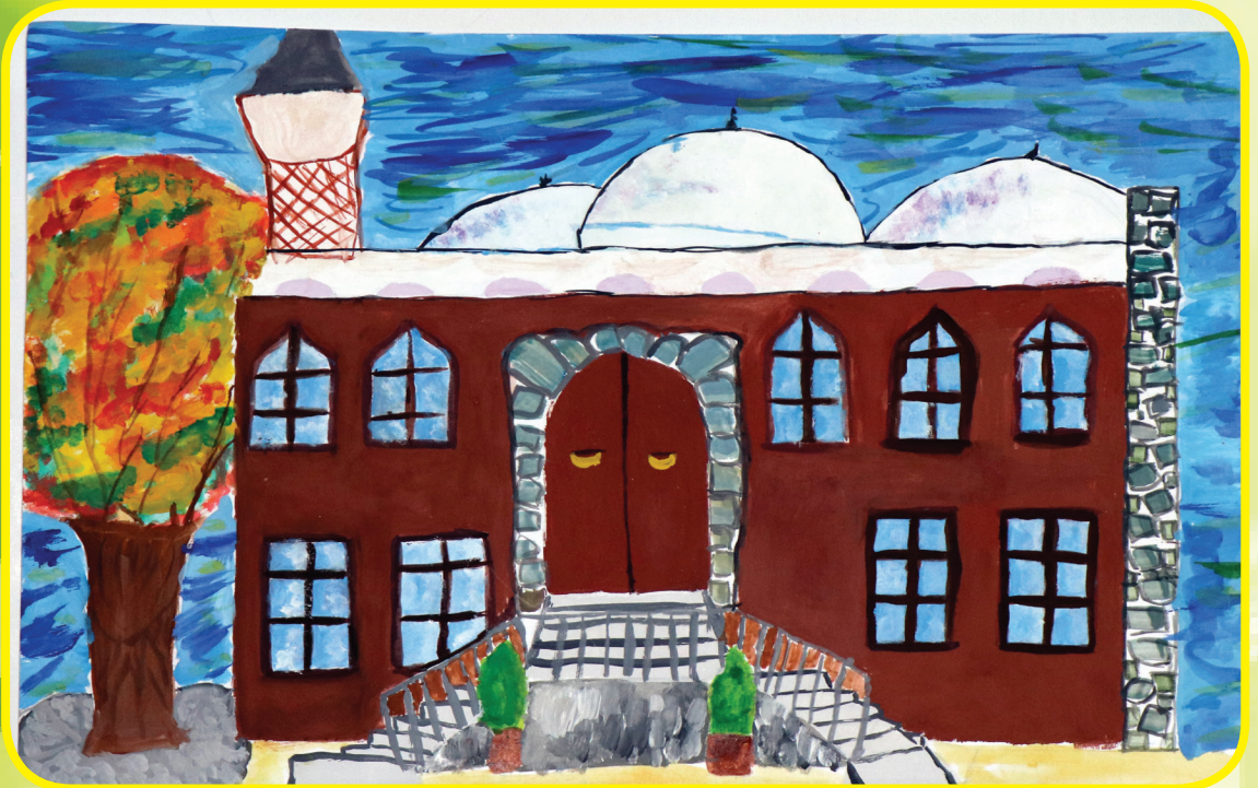
Büşra Veli, Plovdiv Bölge Müftülüğü.