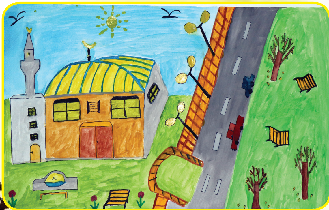
Гюлшен Караали, Районно мюфтийство-Разград