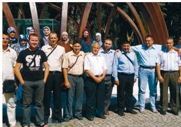
Главно мюфтийство организира семинар за учителите по „Религия-ислям“ в Истанбул, Турция на 1-6 юли 2012 год.

На 14 юни 2012 г. в Средно общообразователно училище в Момчилград се проведе състезание по четене на Коран, изпълнение на езан и наизустяване на хадиси. Състезаваха се учениците от трите средни духовни училища – Момчилград, Русе и Шумен.