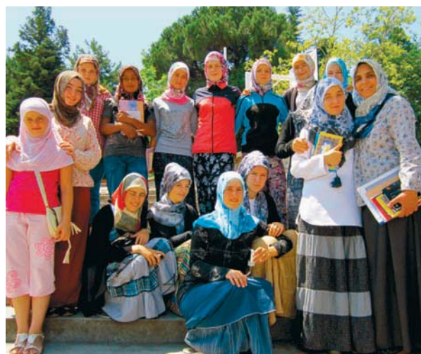
Учениците от Средно общообразователно училище в Момчилград от 16-20 май 2012 година участваха в състезание по арабски език в град Бурса, Турция.