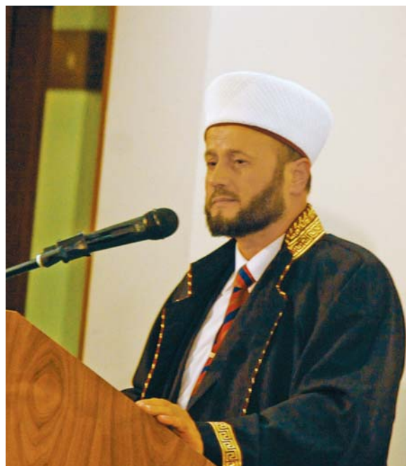
Приветствени слова бяха поднесени и от бившите главни мюфтии, които изразиха благодарност за поканата, като изтъкнаха, че винаги ще подкрепят демократично избраното ръководство на Главно мюфтийство.