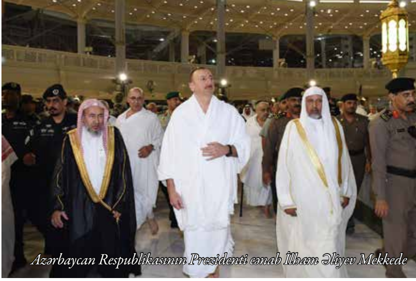
Azərbaycan Respublikasının Prezidenti cənab İlham Əliyev Məkkədə

Oyunlarının ev sahibi olmaq və “2017-İslam Həmrəyliyi İli: Dinlər və mədəniyyətlərarası dialoq” mövzusunda konfransı keçirməklə birlik ruhunda İslamın sülh və mədəniyyət dini olduğunu bütün dünyaya nümayiş etdirmişdir.