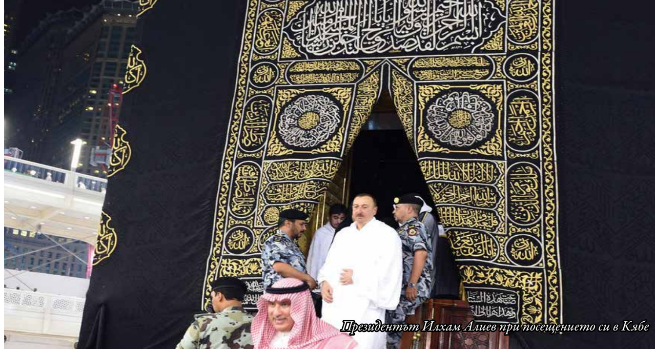
Президентът Илхам Алиев при посещение си в Кябе