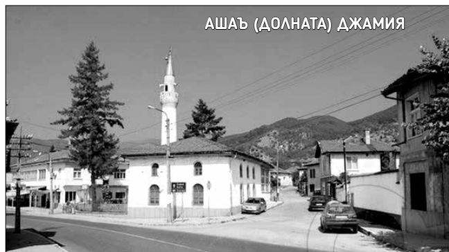
АШАЪ (ДОЛНАТА) ДЖАМИЯ

Построена е в центъра на селото и е приета за централната джамия. Според местното население тя е съградена много след „Ески джамия“. Стените на джамията са от каменен зид с дебелина 1 метър. Общата дължина на джамията с преддверието и молитвения салон е 20 м, ширината ѝ е 12 м, а височината ѝ – около 4,5 м. Като почти всички селски джамии и „Долната джамия“ в село Розино е с четирикатен покрив. Прозорците са на два реда и наброяват 14 броя. Михрабът представлява една издълбана в стената ниша, оформена в горната част със стилактитов орнамент, ограден с каменна релефна рамка, очертаваща голямо правоъгълно пано, запълнено със специфична украса. Минберът, който се използва за празнични проповеди, се намира отясно на михраба. А от лявата страна на михраба