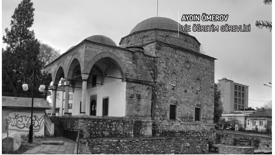
AYDIN ÖMEROV YİE ÖĞRETİM GÖREVLİSİ

Dikdörtgen planlı harimi 10x10 ebatlarında olup tam bir kubbe ile örtülüdür. Giriş önündeki yarım kubbe