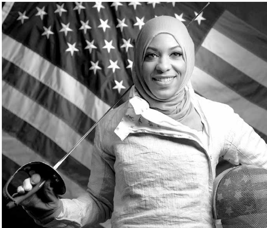
Ибтихадж Мухаммед е първата мюсюлманка, която през всичките години в състезанията по фехтовка се облича с хиджаб.

но, всички положителни промени подобряват качеството на живот и осигуряват на активно спортуващите не само дълголетие, а и повишено самочувствие и по-висок жизнен тонус. ☼