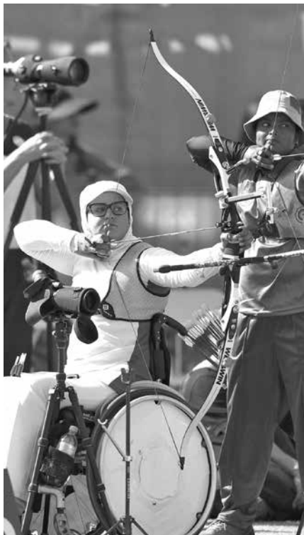
Зехра Немати - стрелба с лък