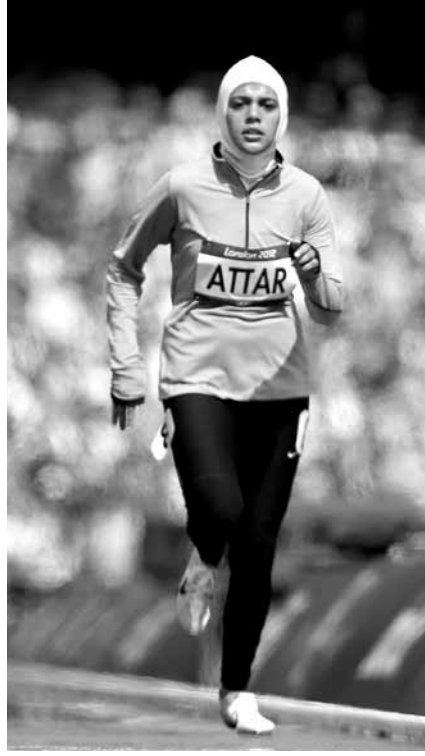
Sarah Attar - atletizm 800 metre