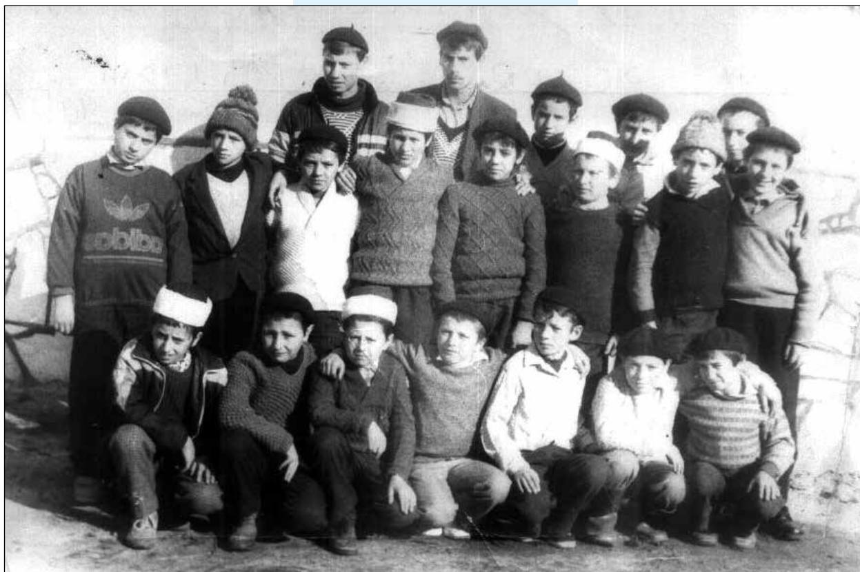
Курс за изучаване на Корана през 1990 г. в село Рибново

ИЗВОД: Някога старите учени си задавали въпроса: „Колко души уби днес?“ Целта, естествено, не е била да се убиват хора, а да се замислят: Колко души поради тебе изстинаха от Корана и джамията и стана причина да се откъснат от армията на учените? „Макар че към летните курсове за изучаване на Корана ние пристъпваме с най-добри намерения, често се случват и моменти, когато вместо да изпишем вежди изваждаме око. Джамииите, летните курсове за изучаване на Корана са подходящи места за превръщане на убийци. Би трябвало да се страхуваме от това!