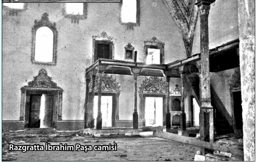
Razgratta İbrahim Paşa camisi

bir soru - devletin el koymuş olması. Ecdat yadigarı bu mabetlerimizin durumu çok üzücü ve utanç verici, değil mi? Modern dünyada tarihi eserlere iki elle sahip çıkıldığı bir çağda yaşıyoruz, ülkemizde ise tam tersi!? Biz de niye böyle diye eziklik yaşıyoruz. Sorunun çözümü için başvurduğumuz ilgili kurumların duyarsızlığı ve camilerimize sahip çıkma gayretlerimize yönelik protesto gösterileri, açık söylemek gerekirse, yaşadığımız toplumda dini değerlerimize saygının ve hoşgörünün göstergesidir, birilerinin bize hala ikinci sınıf insan muamelesi yapma sevdasından vazgeçememesindedir. Samokov camisi gibi müzeye çevirilmiş veya ulusal anıt ilan edilmiş olan birçok tarihi camilerimiz esas kullanım amacına aykırı olarak ibadete kapalı olmamalı. Bu kabul elilir birşey değildir. Temennimiz odur ki, her halükârda cami