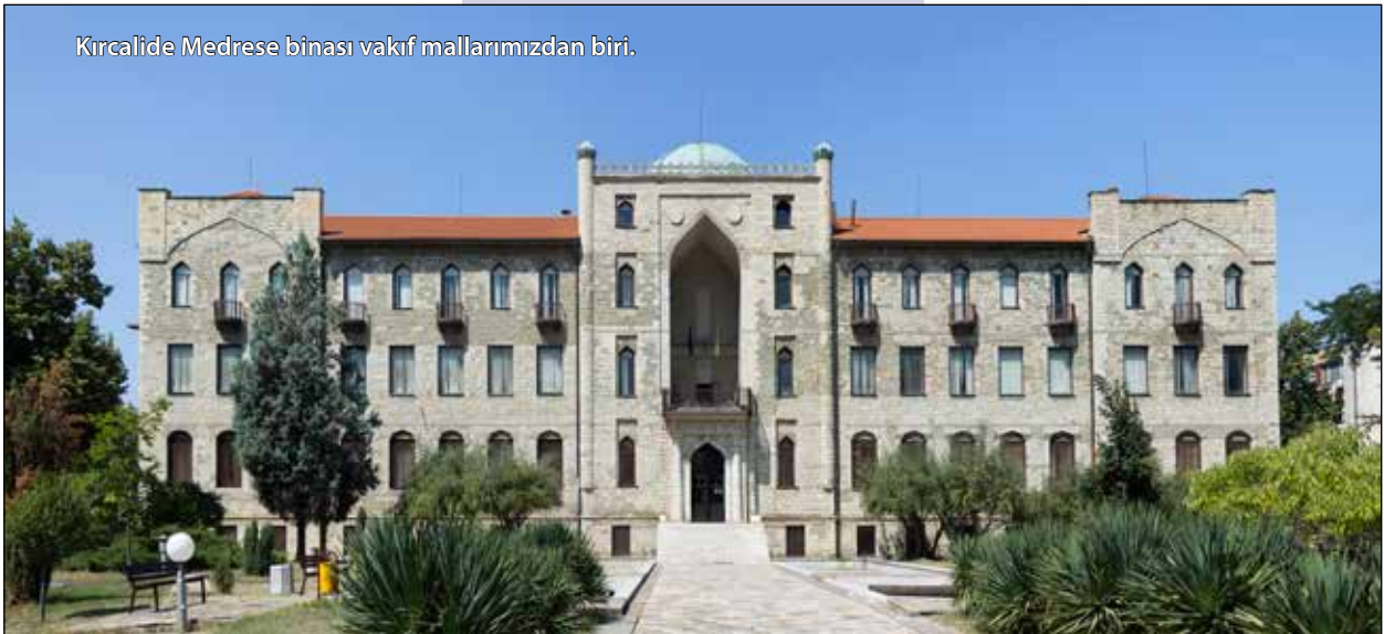
Kırcaali Medrese binası vakıf mallarımızdan biri.

Herkesin özel çalışma uslubü olması çok normaldir. Bazıları müslümanlara vaaz ve nasihata daha çok önem veriyorlar, bazıları da yazmak ve teknik imkanları kullanmak suretiyle müslümanlara ulaşmayı uygun görmekteler. Unutmamak gerekir ki,