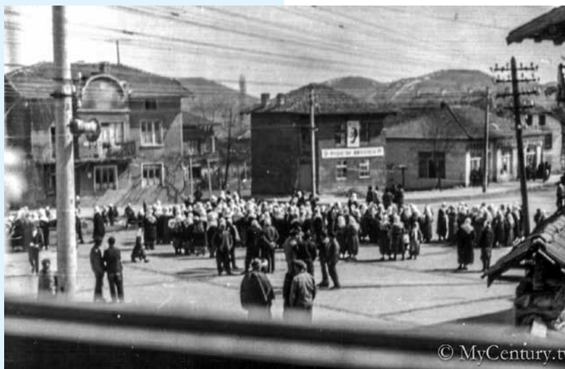
Снимка от гражданския протест на населението на с. Корница срещу насилствената смяна на имената през 1973 год.

но читалище «Назъм Хикмет» е направен обиск. Какво ще кажете по този въпрос?