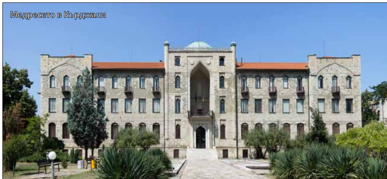
Медресето в Кърджали

Докато очаквахме справедливи решения от съдебните органи, видяхме и бяхме свидетели как те бяха принудени да работят под натиска на гълпите, ор-