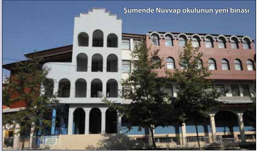
Şumende Nüvvap okulunun yeni binası

Devlet okullarında okutulan dersler son derece önem taşıyor. Yaşadığımız toplumun kurtuluşu din eğitimine bağlıdır diye yukarıda söyledim. Bu gerçeği herkes ve özellikle siyasetçilerin anlamaları gerekiyor. Maalesef, birçok meseleler gibi okullardaki din eğitimi de ticaret oldu. Bazı okul müdürleri kendilerine yakın olan öğretmenlere yeterince ders oluşturup maaşları düzgün olabilmeleri için, öğrencilere din dersleri değil de beden eğitimi veya başka dersler seçtiriyorlar. Kısaca toplumumuzun okullarda okutulan din derslerinin önemini anlaması ve elinden geleni yapması lâzım.