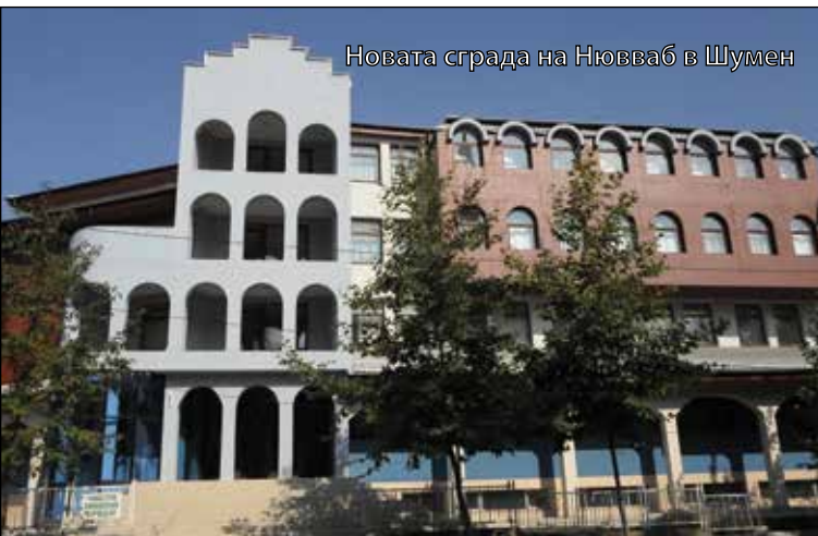
Новата сграда на Нювваб в Шумен

ганизиран от националистическите сили. Успяха ли съдебните власти да устоят на този натиск или не?