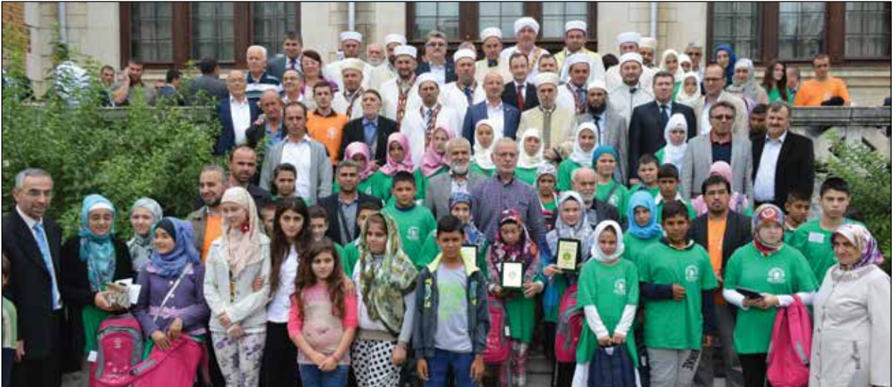
Şumende Ulusal Kur'ân yarışması katılımcıları ve din adamlarımız

Şöyle ifade edeyim, zamanda gaspedilen vakıf mallarının iadesi yeni dönemde sürekli Başmüftülüğün gündeminde var olmuştur. Ne yazık ki, bu süreç değişik sebeplerden do-