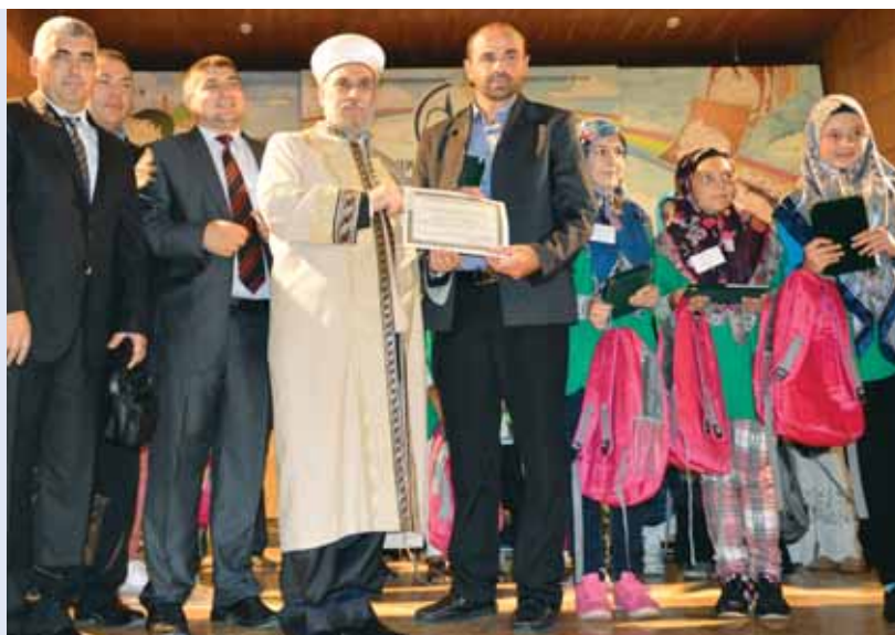
Главният мюфтия д-р Мустафа Хаджи с журито и отличилите се в състезанието

В Шумен се проведе Национално състезание по основни познания за исляма. То бе разделено на две части. Първата част се състоеше от предварителен кръг, на който се явиха представители на 21 районни мюфтийства от цялата страна. Това бяха групи от Коран курсовете, които са спечелили най-висок бал на предварителните регионални състезания или тестови задачи. Номинираните състезатели се бяха събрали в Духовното училище "Нювбаб" за провеждането на предварителния кръг. Всички участници показаха високи резултати, което затрудни журито. За втората същинска част бяха номинирани групите от районните мюфтийства в Разград, Смолян и Пловдив. През втория ден в читалище „Добри Войников“ бе проведено същинско-