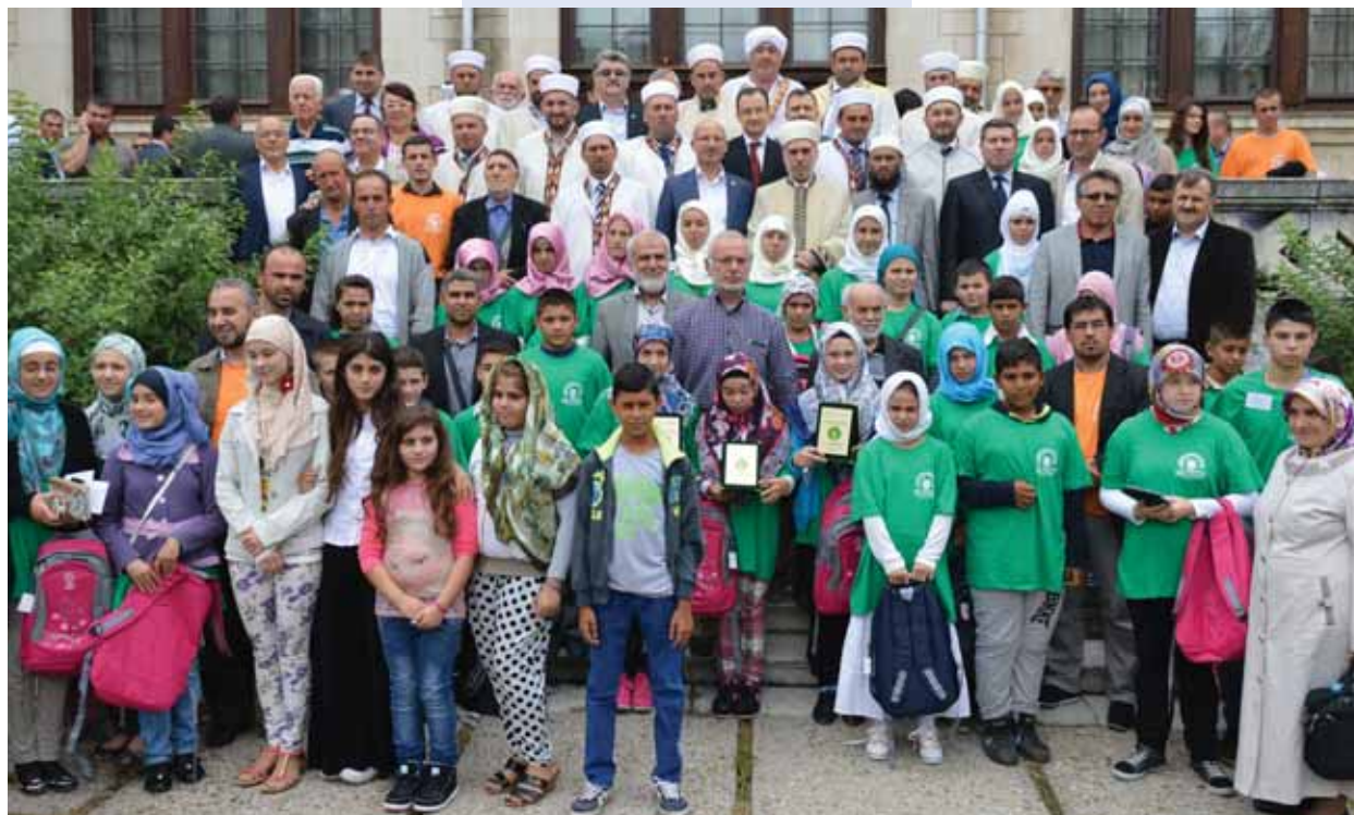
Участниците в осмото национално състезание по основни познания за исляма заедно с ръководителите на курсовете по изучаване на Коран-и керим и мюфтиите.

ва: На трето място Смолян, на второ място Разград и на първо място Пловдив. Главно мюфтийство благодари на всички участници от Коран курсовете през тази година, на преподаватели и спонсори на състезанието. (Собств.инф.)